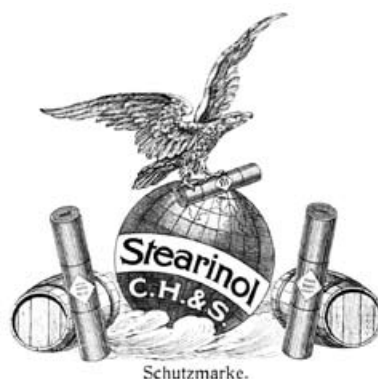
Защищенная марка 1900

Успех нашей продукции объясняется системным подходом и ее комплексным применением. Отлаженное взаимодействие различных слоев кровельного покрытия не в последнюю очередь обеспечивает функциональную и технологическую надежность для проектировщиков, исполнителей и заказчиков строительных работ. Долговечность без дополнительных расходов являются главным преимуществом кровельных систем Kubidritt .